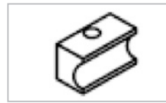
• Contre forme coulissante