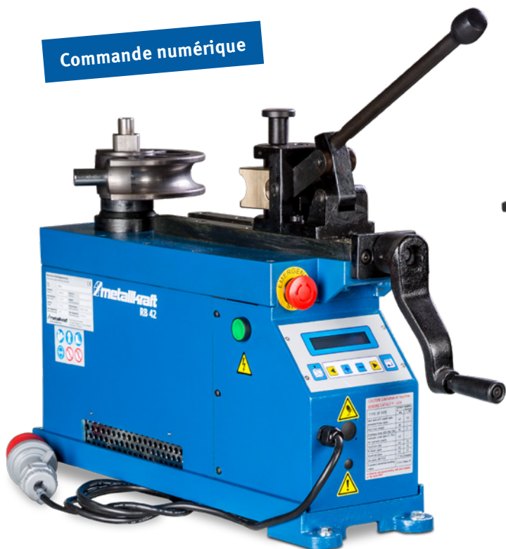
Fig. : RB 42