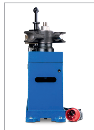
· Vue arrière RB 42