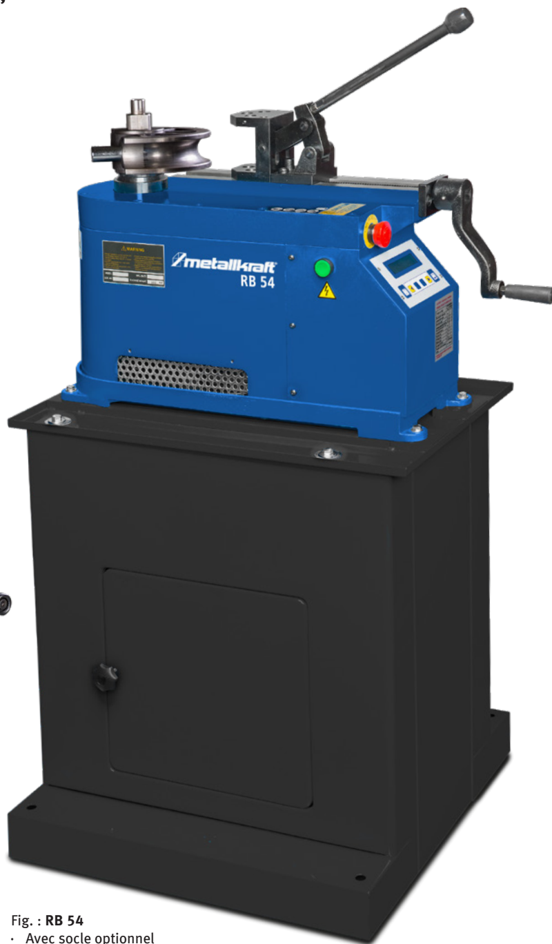
Fig. : RB 54