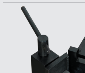
• Mors de serrage excentrique pour un blocage rapide de la pièce à cintrer