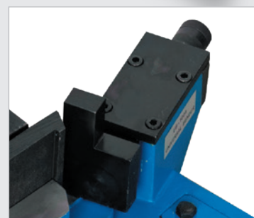
• Plaque de cintrage avec entraînement par vis sans fin permettant un positionnement facile et rapide