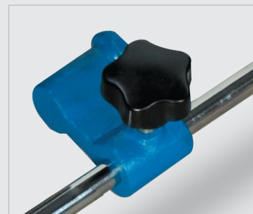
• Butée de longueur