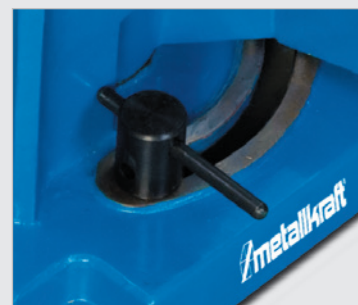
• Réglage de l'angle en continu